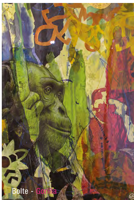
Bolte - Gorilla