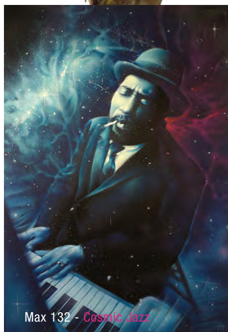
Max 132 - Cosmic Jazz